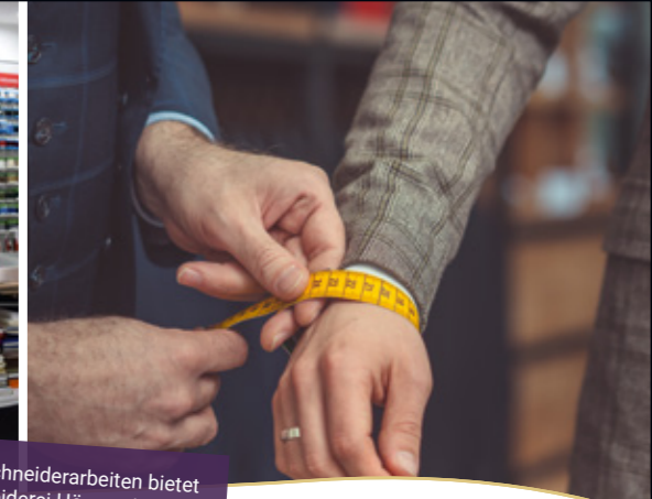
Neben Schneiderarbeiten bietet die Schneiderei Högen eine große Auswahl an Kurzwaren wie Knöpfe, Bänder, Ösen etc.

mustert werden – oft reichen schon kleine Reparaturen. Hochwertige Hemden, Hosen, Kleider oder Röcke, die etwas aus der Mode gekommen sind, verwandeln die erfahrenen Fachleute durch ein paar Upgrades in einen modernen und zeitgemäßen Look.