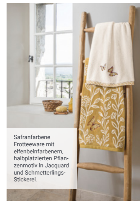
Safranfarbene Frotteeaware mit elfenbeinfarbenem, halbplatzierten Pflanzenmotiv in Jacquard und Schmetterlings-Stickerei.