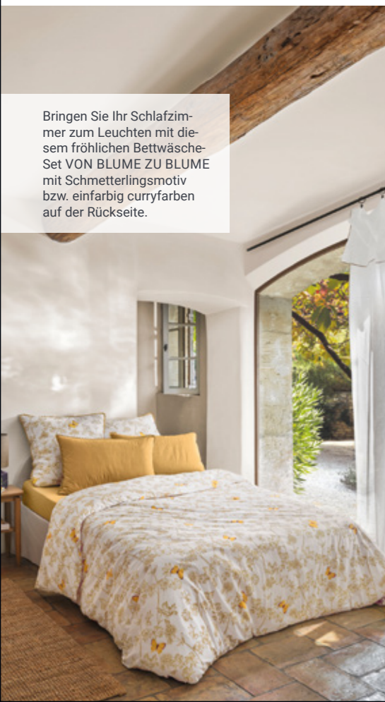
Bringen Sie Ihr Schlafzimmer zum Leuchten mit diesem fröhlichen Bettwäsche-Set VON BLUME ZU BLUME mit Schmetterlingsmotiv bzw. einfarbig curryfarben auf der Rückseite.