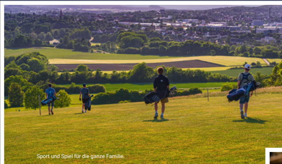
Sport und Spiel für die ganze Familie.

Fehlt noch die Kultur in unserem Dreiklang: Kultur. Genuss. Golf. Kulturfreunde finden auf www.bayreuth.de ein vielfältiges Angebot. (ps)