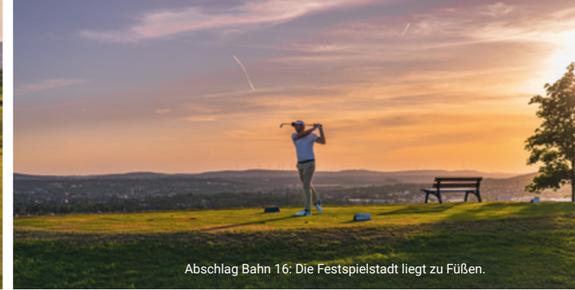
Abschlag Bahn 16: Die Festspielstadt liegt zu Füßen.