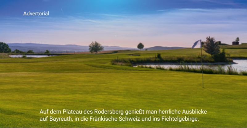
Auf dem Plateau des Rodersberg genießt man herrliche Ausblicke auf Bayreuth, in die Fränkische Schweiz und ins Fichtelgebirge.