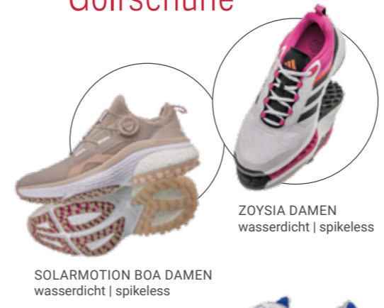
SOLARMOTION BOA DAMEN wasserdicht | spikeless