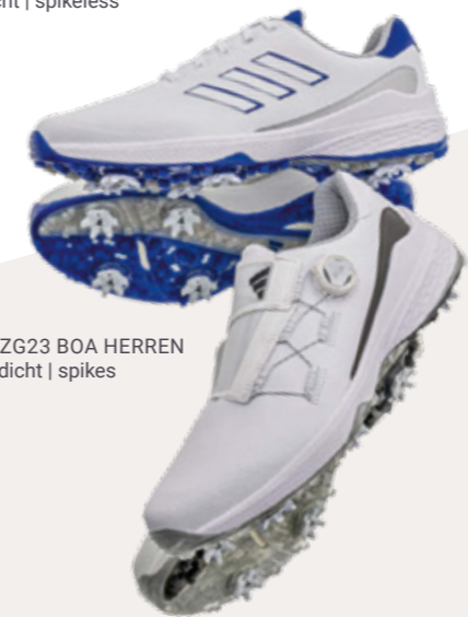
ZG23 | ZG23 BOA HERREN wasserdicht | spikes