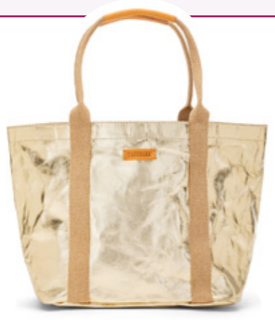
Giulia Bag – hier in der Metallic Farbe Platino.

und zählt mittlerweile 30 Mitarbeiter, davon 90 % Frauen und fast alle Mütter.